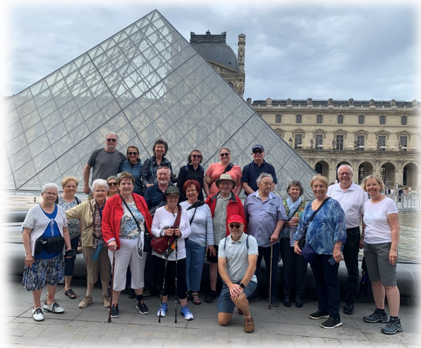
Le groupe devant la pyramide du Louvre