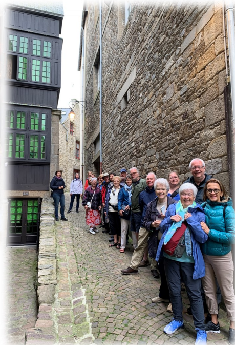
À droite : Visite de Saint-Malo