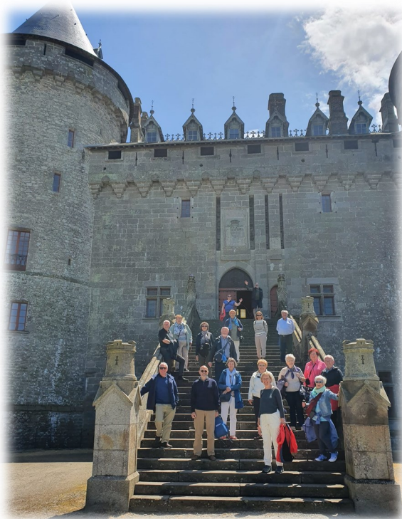
À droite: Visite du château de Combourg