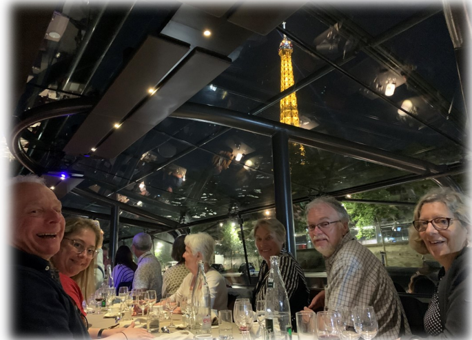
Souper sur la Seine à Paris