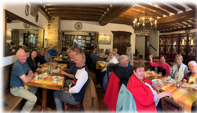
Ci haut: Resto au Mont St-Michel;