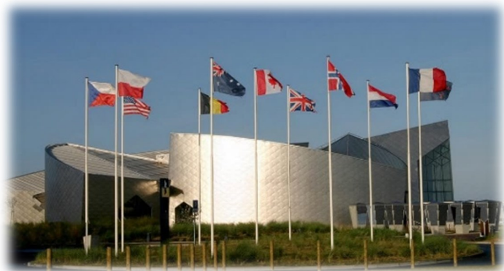
Centre d'interprétation Canadien de Juno Beach

La Normandie garde à jamais les traces de cette histoire. Il suffit de visiter un des nombreux 'bunkers' du mur de l'Atlantique toujours sur place pour le constater.