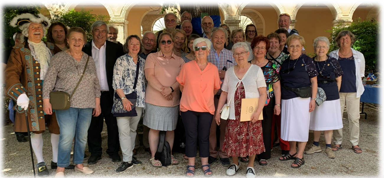
En haut à gauche: Le groupe à l'église Saint-Sauveur lors du dévoilement de la plaque.