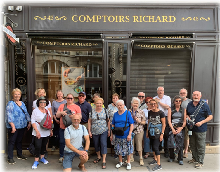
À gauche: Le groupe devant un comptoir des Cafés Richard qui était malheureusement fermé à Paris.